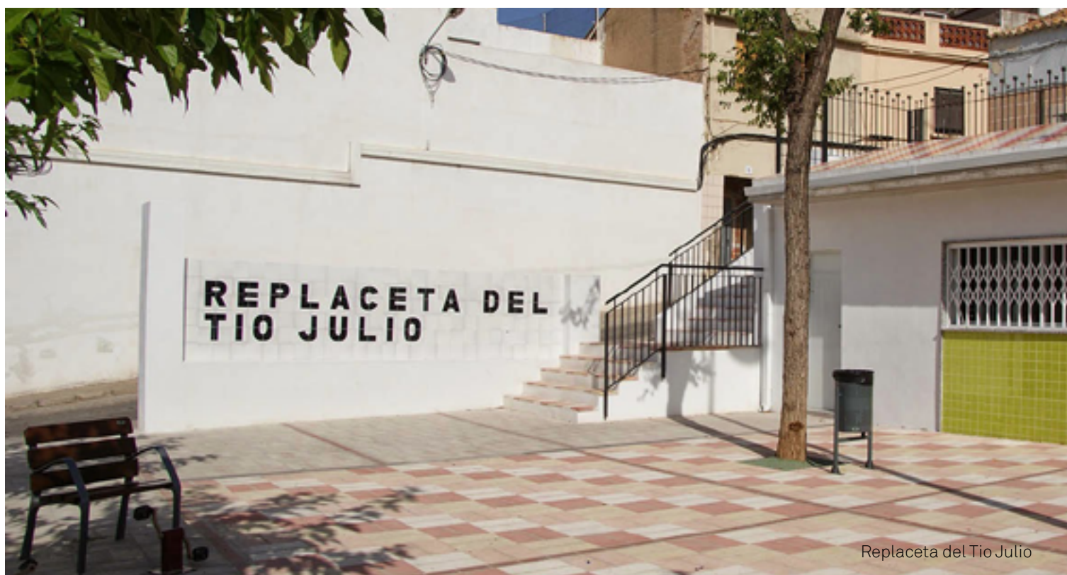
Replaceta del Tio Julio