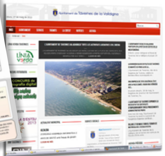
Nova pàgina web